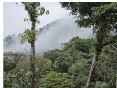
Monteverde / Foret de nuages